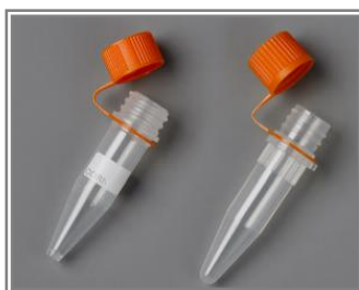
カタログ番号430909の変更前 (左) 変更後(右)

コーニングのスクリーキャップマイクロセントリフュージ(カタログ番号430909, 430915, 430917)のデザイン・仕様を変更しました。従来品より透明なバージンポリプロピレンで製造されているので中身の確認が容易です。その他の変更点は下表の通りです。製品の寸法にも多少変更がありますが、チューブの容量に変更はありません。